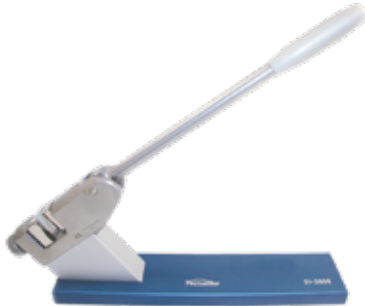
テーブルトップベンダー