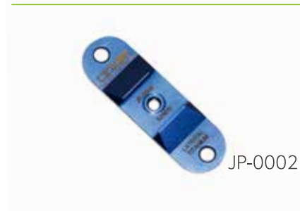
ペクタスバー チタン用 スタビライザー