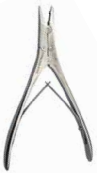
ペクタスバー チタン用 プラグインサーター