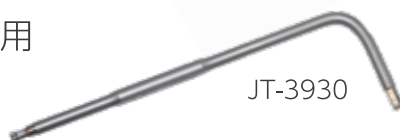
ペクタスバー チタン用 ドライバー