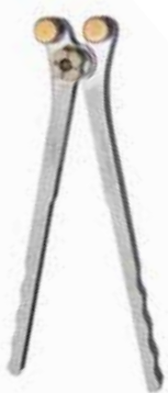
ペクタスバー チタン用 ベンダー